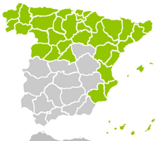
Gráfico 1. Implantación de Intereco en España